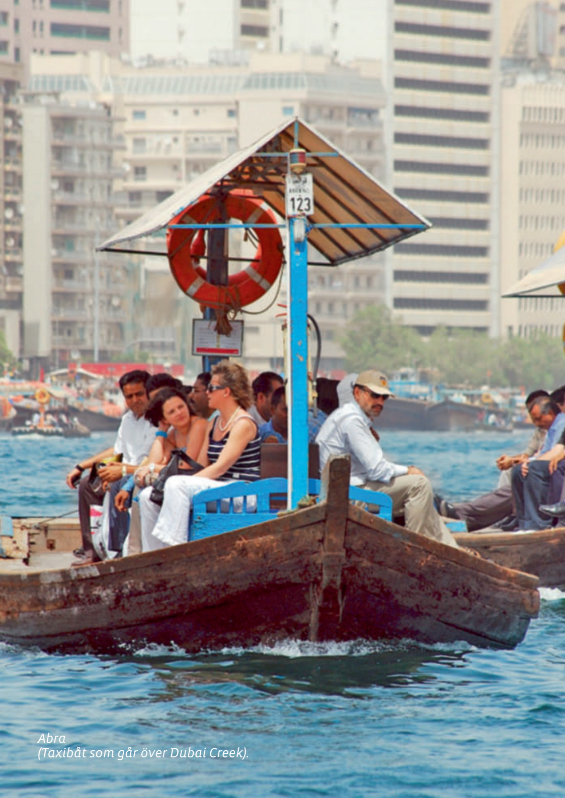
Abra (Taxibåt som går över Dubai Creek).