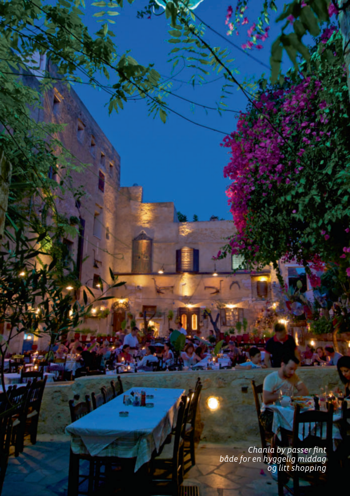
Chania by passer fint både for en hyggelig middag og litt shopping