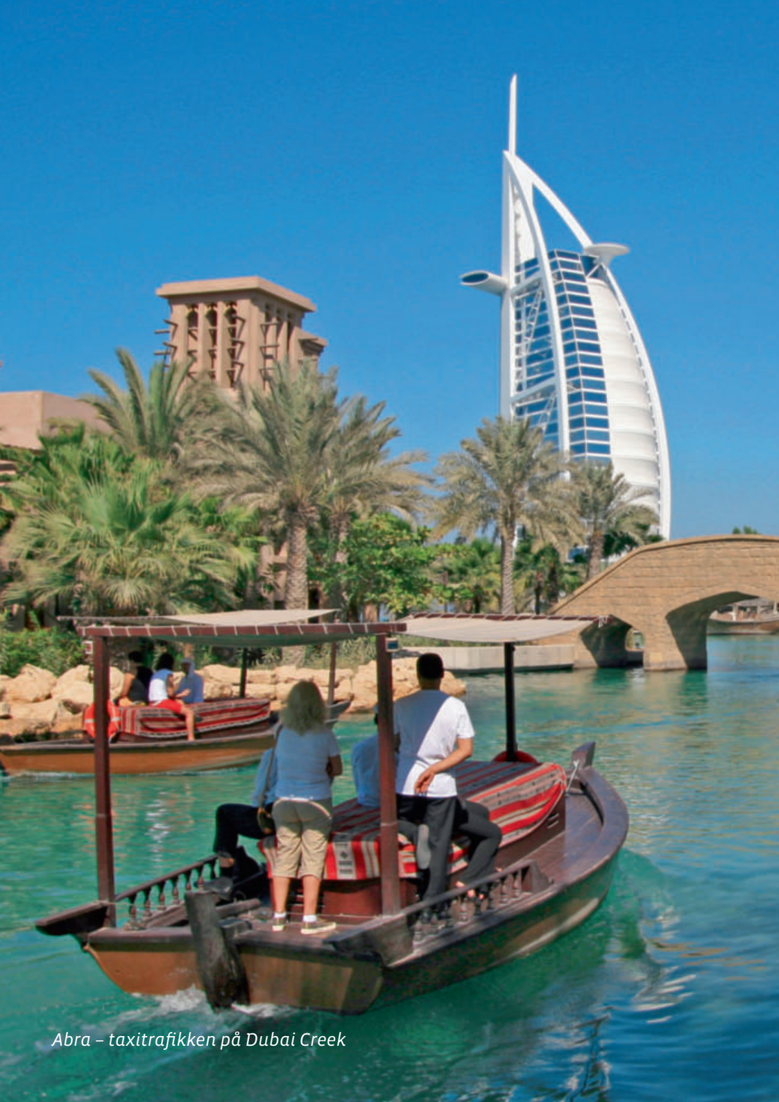
Abra – taxitrafikken på Dubai Creek