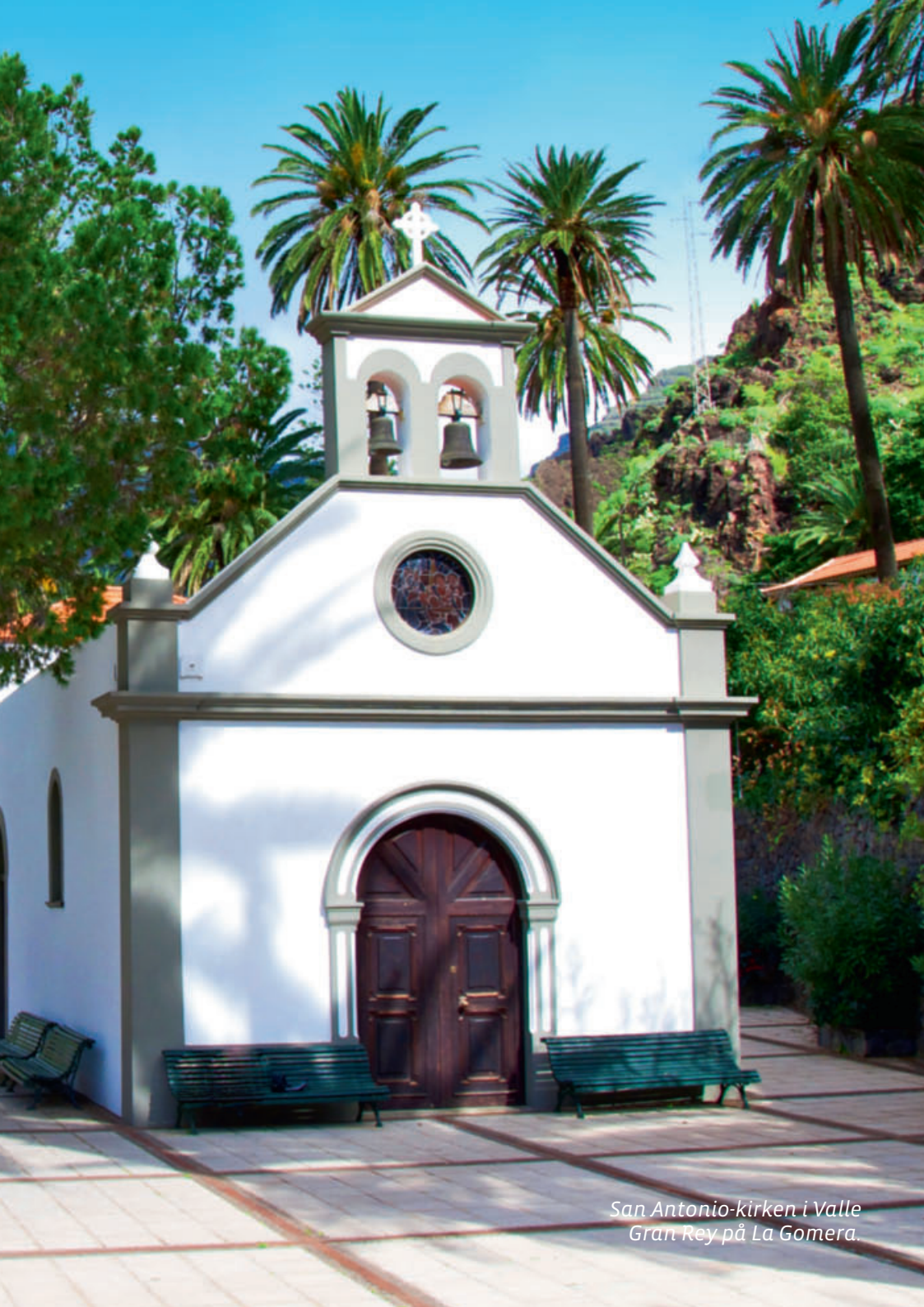
San Antonio-kirken i Valle Gran Rey på La Gomera.