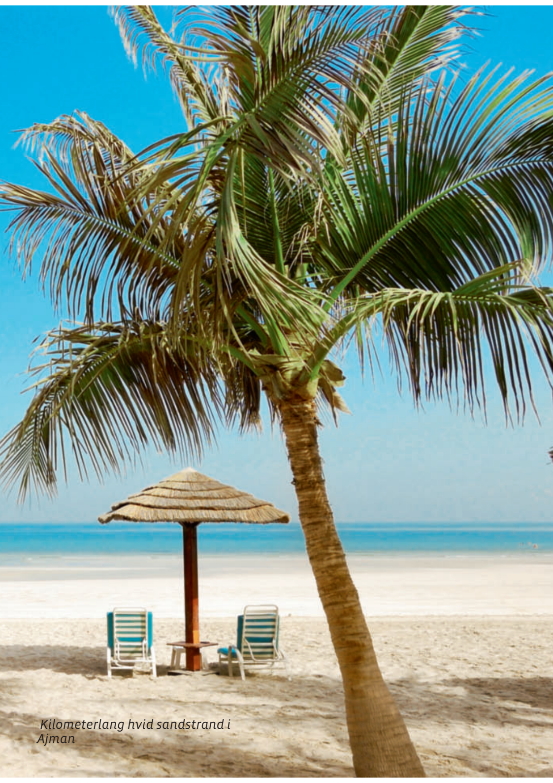
Kilometerlang hvid sandstrand i Ajman